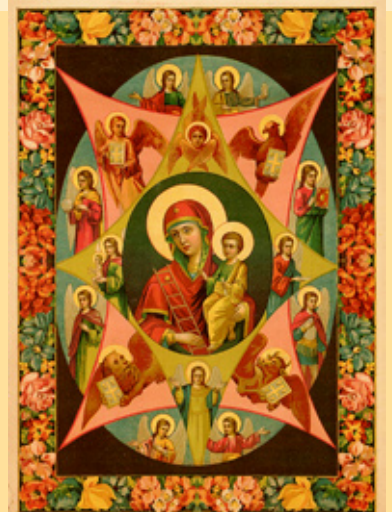
Образ Пресвятой Богородицы Неопалимая Купина.

ниеносным громом устрашаеми будем, яви нам милостивное Твое заступление и державное вспоможение, да спасаемы всеильными Твоими ко Господу молитвами, временнаго наказания Божия zde избегнем и вечное блаженство райское тамо унаследуем и со всеми святыми воспоем пречестное и великолепое имя покланяемая Троицы, Отца и Сына и Святаго Духа, и Твое велие к нам милосердие, во веки веков. Аминь».